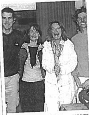
Les vainqueurs

■ Le 5 e trophée des entreprises landaises est revenu cette année à l'école de surf (Capdeville-Ja- met) devançant la ville de Mont- de-Marsan (Mensan-Cabanes). Le Bonifieur (V. et T. Jacquemin), vainqueur en 2004, prenait la troisième place tandis que Maisa- dour (Gissot-Frein) échouait au pied du podium.